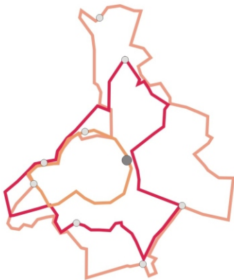
CIRKELVORMIGE/ TANGENTIËLE LIJNEN